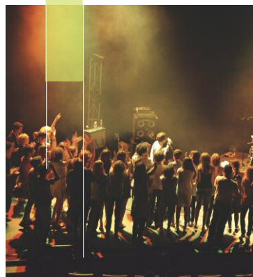
HOUSSE DE RACKET

Vous devez également remettre à la Sacem le programme détaillé des œuvres musicales utilisées lors de l'événement. Grâce à ce programme, la Sacem peut reverser les droits perçus aux créateurs avec une précision totale, œuvre par œuvre.