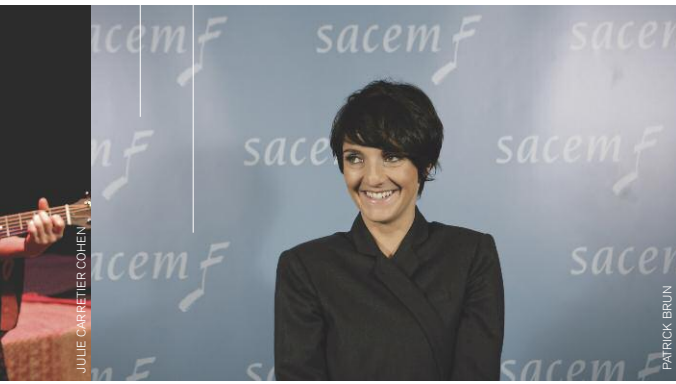
FLORENCE FORESTI GRAND PRIX SACEM 2010