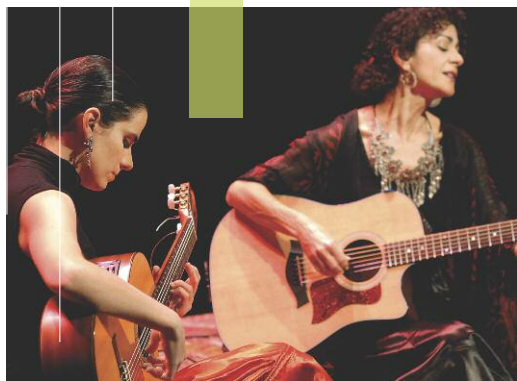
ANGÉLIQUE IONATOS AVIGNON 2011

Plus d'informations sur les critères d'éligibilité aux aides de la Sacem : sacem.fr et auprès de la Division culturelle .