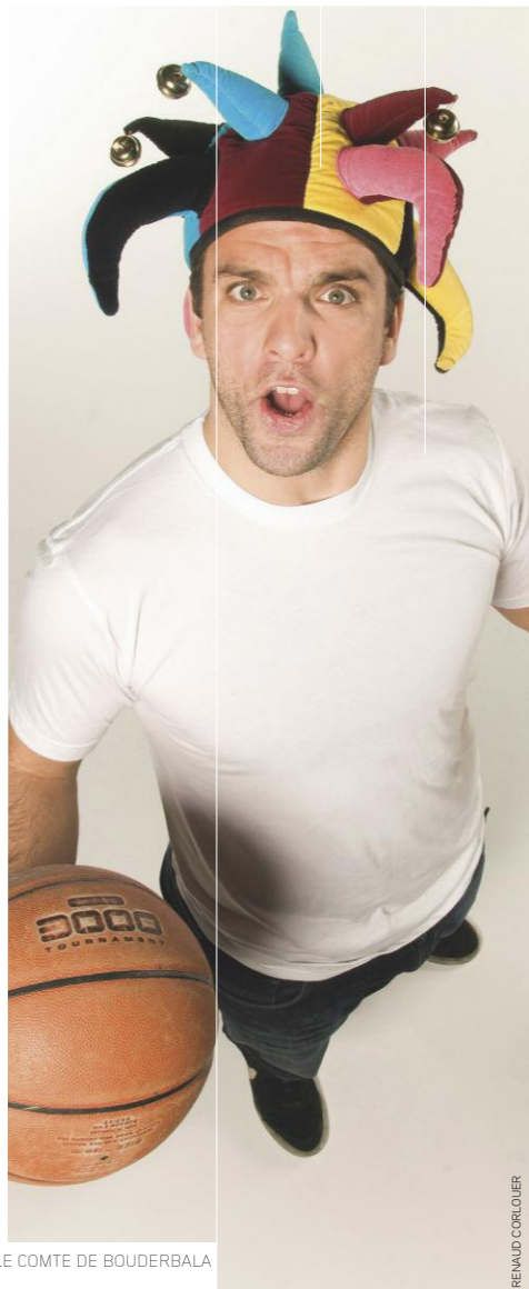
LE COMTE DE BOUDERBALA