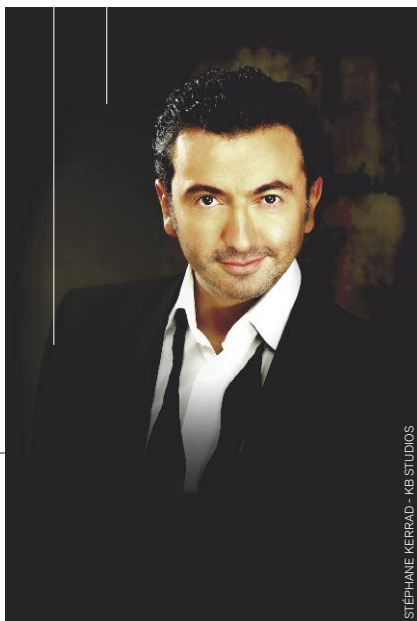
STÉPHANE KERRAD - KB STUDIOS